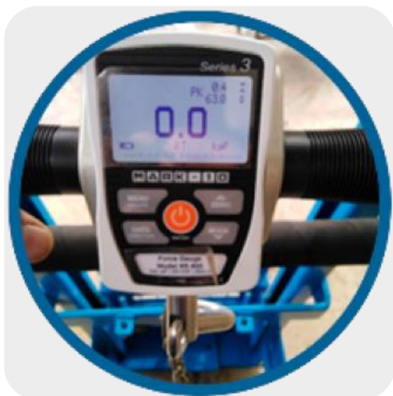
ILUSTRACIÓN 4. REGISTRO DE PRUEBA DEL DINAMÓMETRO EN EL PUNTO 03.

Punto de apoyo: en el centro del manubrio