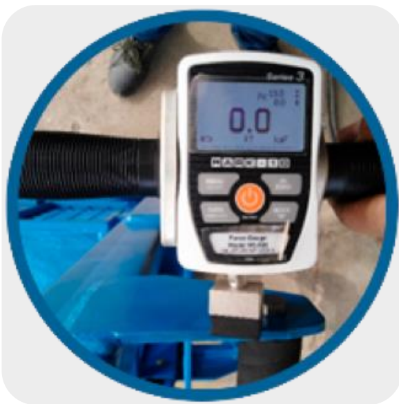
ILUSTRACIÓN 1. DINAMÓMETRO DE PRUEBAS.

Fuerza de resbalamiento: no presenta resbalamiento con la fuerza ejercida en el punto elegido