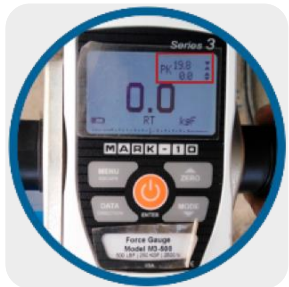
ILUSTRACIÓN 2. REGISTRO DE PRUEBA DEL DINAMÓMETRO EN EL PUNTO 01.