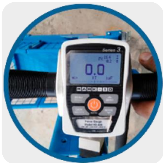
ILUSTRACIÓN 3. REGISTRO DE PRUEBA DEL DINAMÓMETRO EN EL PUNTO 02.

Fuerza de resbalamiento: no hay resbalamiento